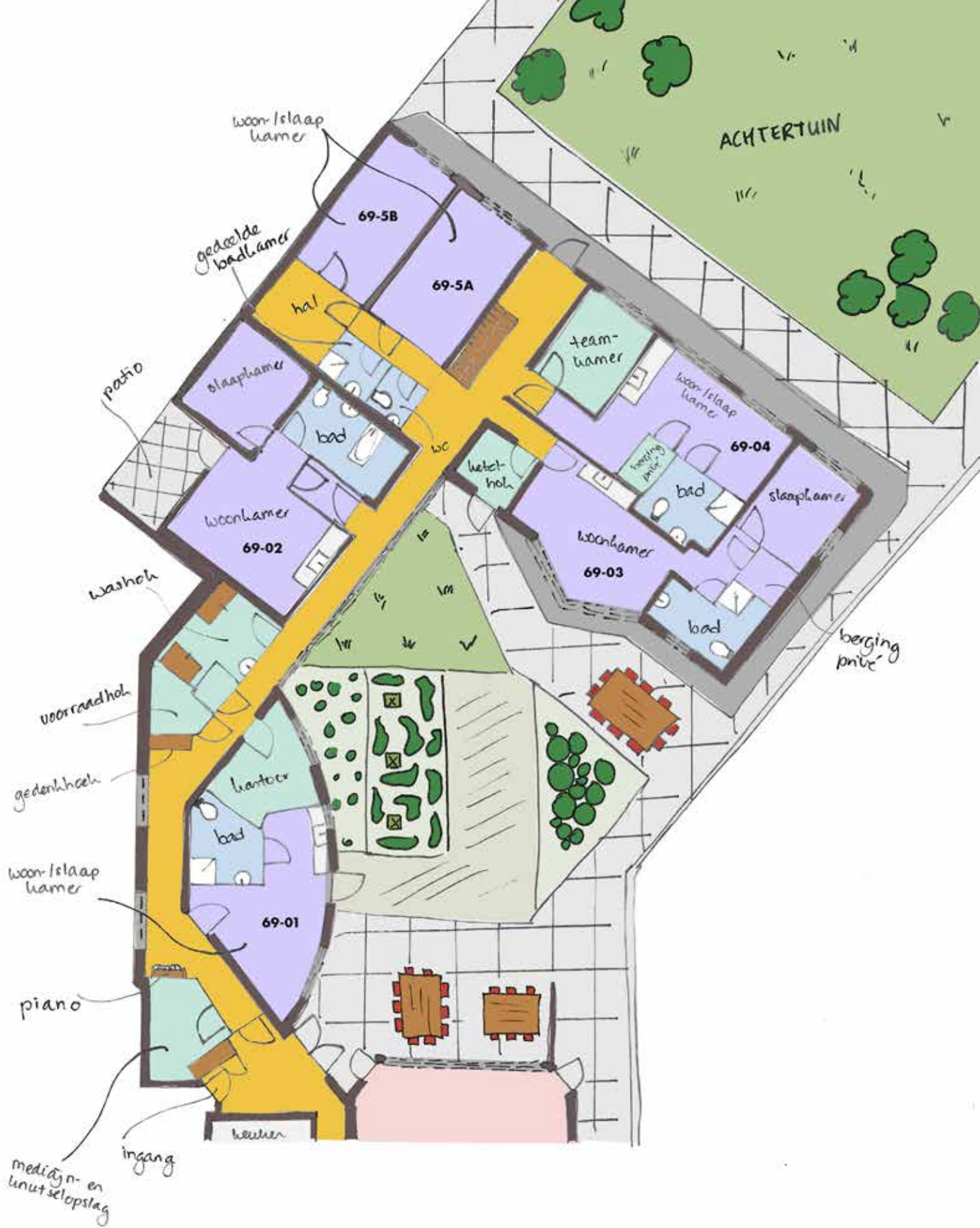
Begane grond nieuwbouw