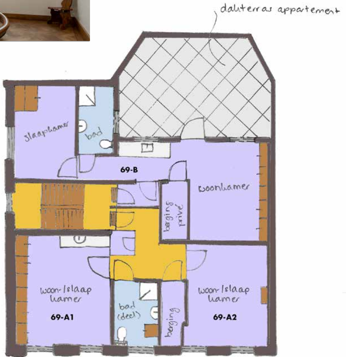
Eerste verdieping outbouw