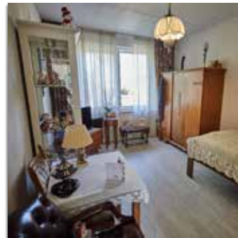
Eerste verdieping nieuwbouw