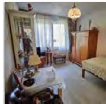
Eerste verdieping nieuwbouw