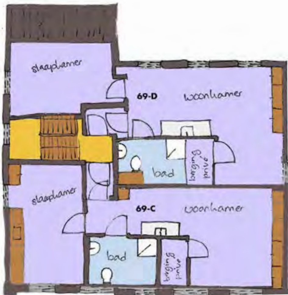
Tweede verdieping oudbouw