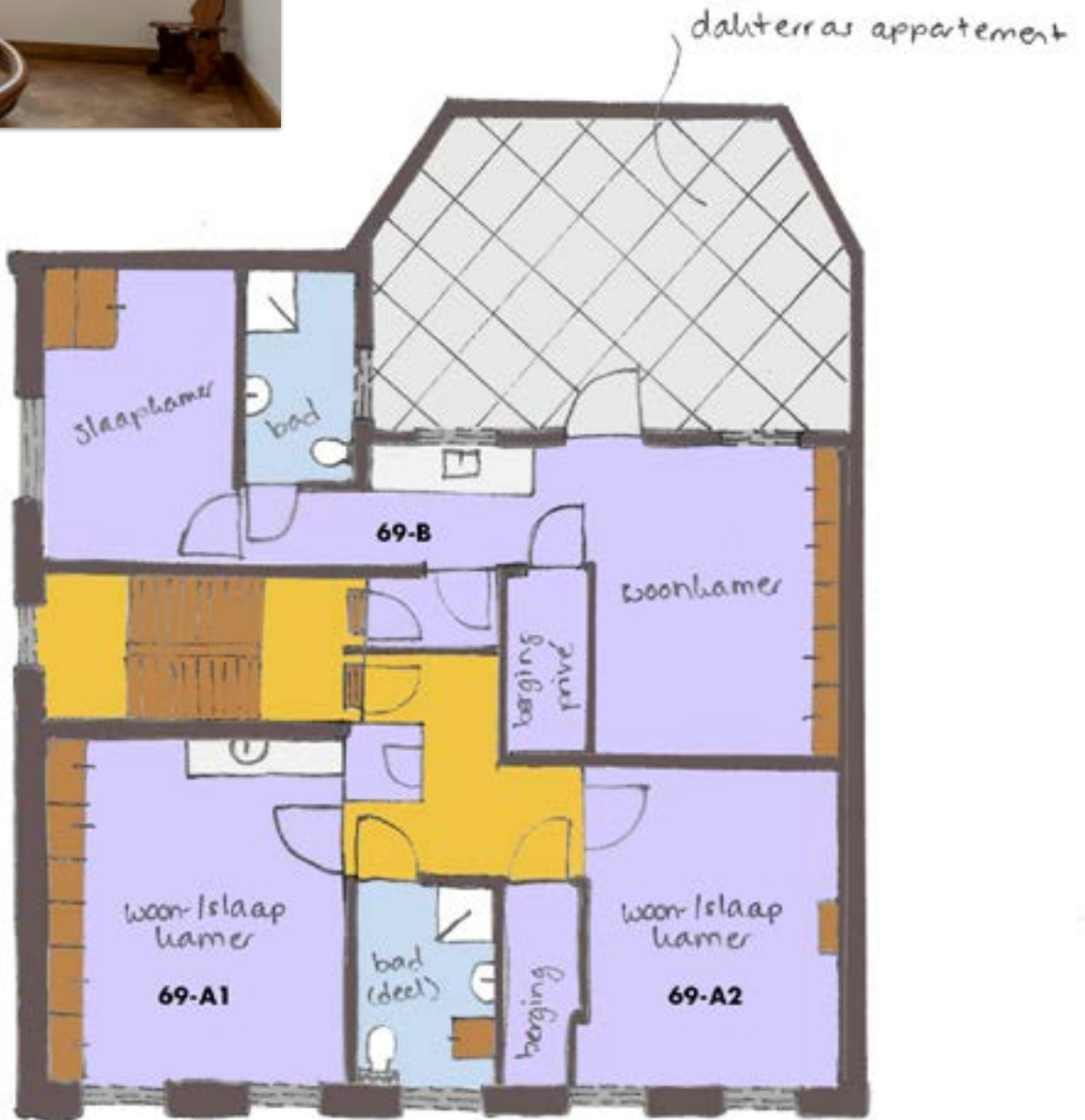
Eerste verdieping oudbouw