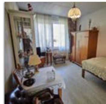
Eerste verdieping nieuwbouw