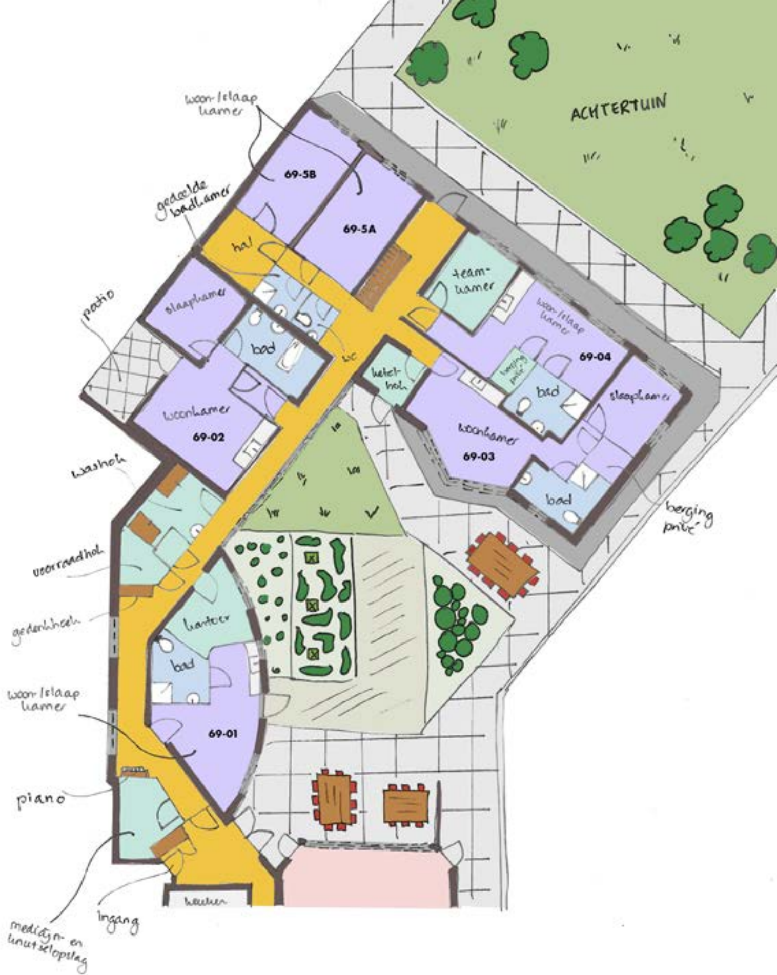
Begane grond nieuwbouw